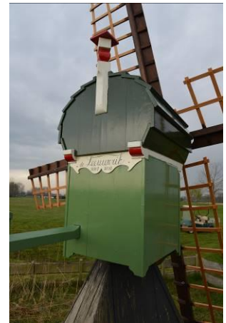
Weidemolen in de Wijde Wormer

Op verzoek bleek Vereniging De Hollandsche Molen bereid ook een tweede tranche te verlenen van € 15.000,-. Op dit budget hebben inmiddels zes eigenaren een beroep gedaan.