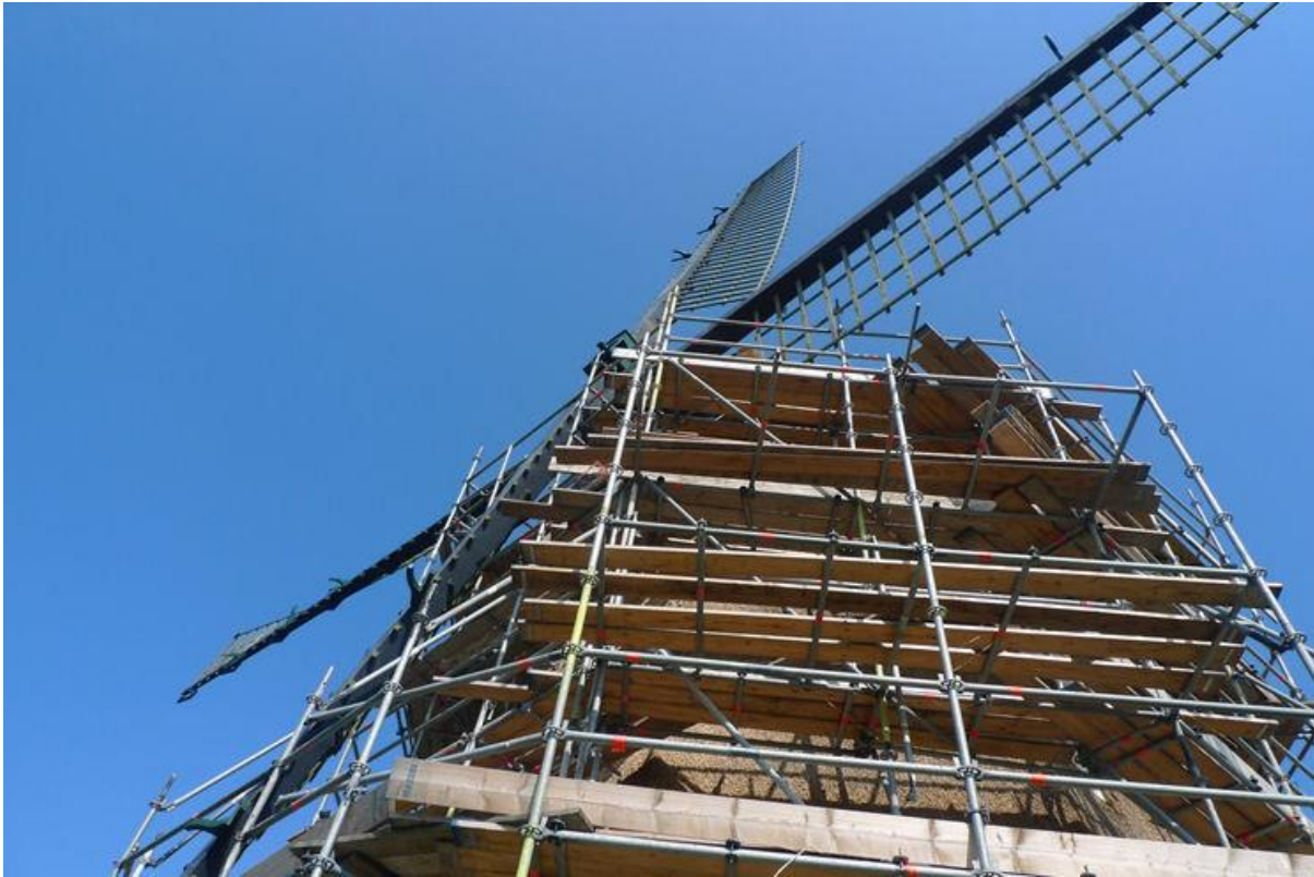
Molen A (Twyuermolen) te Sint Pancras tijdens restauratie