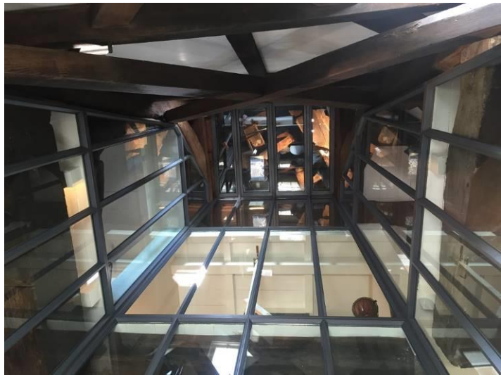
Molen A (Twuyvermolen) Sint Pancras, van binnen

Het herstel van de schade aan de Geestmolen (januari 2015) kon eind november 2016 van start gaan. De schade aan de Twiskemolen (oktober 2016) is reeds gememoreerd. In beide gevallen hoopt men met veel verzekeringspenningen de molens weer in goede staat te kunnen brengen.