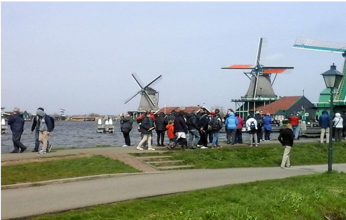
Toerisme op de Zaanse Schans

Ongeveer 1/4 deel van de molens in Noord-Holland beschikt over een eigen ontvangstruimte voor publiek. Het aanbod van activiteiten bij molens is gevarieerd en vaak wordt nauw samengewerkt met lokale ondernemers. Molens spelen ook in op wandel- en fietsroutes. Op 14 en 15 mei vonden de Nationale Molen- en Gemalendagen plaats, waarbij zo veel mogelijk molens draaiden en open waren. De Open Monumentendagen vielen op 10 en 11 september 2016.