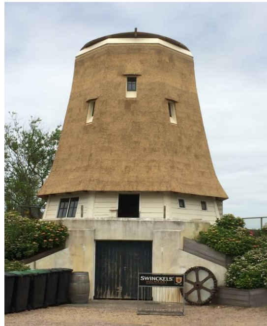
Koffiemolen te Egmond aan de Hoef tijdens restauratie

Maar gelukkig ook goede berichten. De restauraties van de voormalige korenmolen in Egmond aan de Hoef en die van de Damlandermolen in Bergen, lange tijd de twee meest rotte molenkiezen in Noord-Holland, zijn gaande.