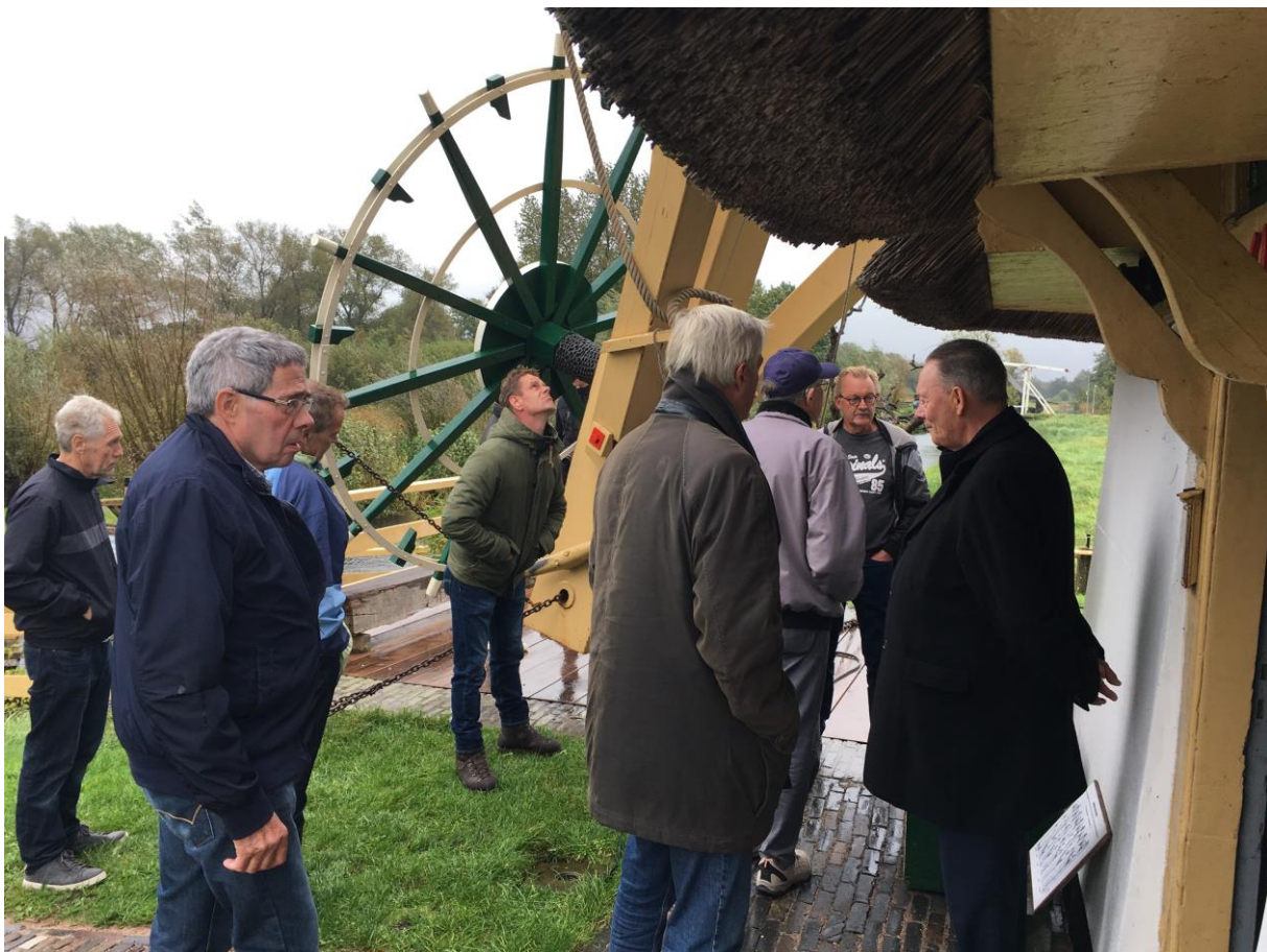
Op bezoek bij Molen De Onrust aan het Naardermeer

Na de lunch, aangeboden door de gemeente Wijdmeren, ging het in bussen langs drie molens in de regio: de molen De Onrust aan het Naardermeer, de Larense molen of Korenmolen, eigendom van de familie Calis en de dag werd afgesloten bij korenmolen De Vriendschap in Weesp met een hapje en een drankje. Het weer hielp niet echt mee in de middag, maar tijdens de bezoeken aan de molens bleven de hemelsluizen zo goed als gesloten. Al met al weer een geslaagde molencontactdag, mede dankzij de financiële steun van de provincie Noord-Holland en natuurlijk de gastvrijheid van de gemeente Wijdmeren.