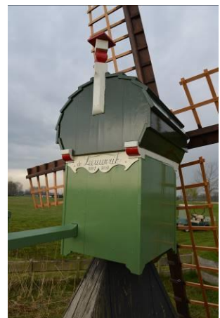
Weidemolen in Wijdewormer

Vereniging De Hollandsche Molen bleek bereid om hiervoor uit een van haar fondsen een bedrag te fourneren, voorlopig voor de periode van één jaar. Het fonds kreeg de naam BankGiro Loterij Weidemolenfonds en iedere particuliere weidemoleneigenaar kon er een beroep op doen. De eerste tranche van het fonds startte op 1 mei 2014 en had een looptijd tot 1 mei 2015. In die periode zijn aan 12 eigenaren van weidemolens bijdragen verstrekt voor de restauratie van hun molens. Op verzoek bleek Vereniging De Hollandsche Molen bereid ook een tweede tranche te verlenen van € 15.000,-. Een deel van dit budget is in 2017 uitgegeven, maar er is ook nog een deel niet gebruikt. Nieuwe aanvragen voor het restaureren van houten weidemolentjes zijn dus nog steeds mogelijk.