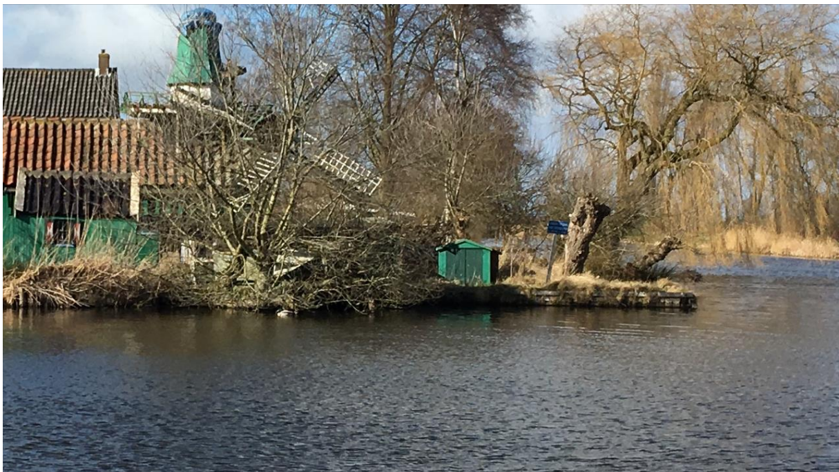
Het wiekenkruis van Biksteenmolen De Vlijt van zijn romp geblazen