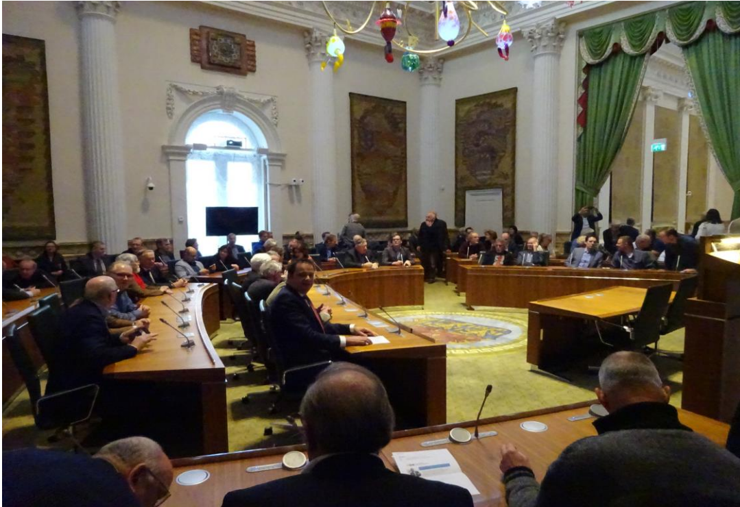
In de Statenzaal, in gespannen afwachting van de bekendmaking van de subsidiebeschikkingen