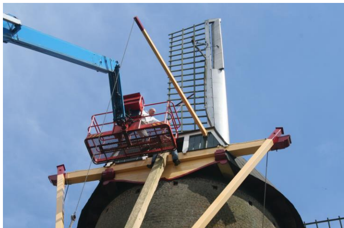
Schilderwerk op hoogte

Een werkgroep van de Molenfederatie heeft in het verslagjaar een set van praktische tips uitgewerkt voor schilderwerk aan molens. Een goede voorbereiding is het halve werk en dat geldt ook voor schilderwerk aan molens. De kwaliteit van de voorbehandeling (o.a. reinigen, schuren en gronden) heeft grote invloed op de uiteindelijke kwaliteit van het schilderwerk. Bij het