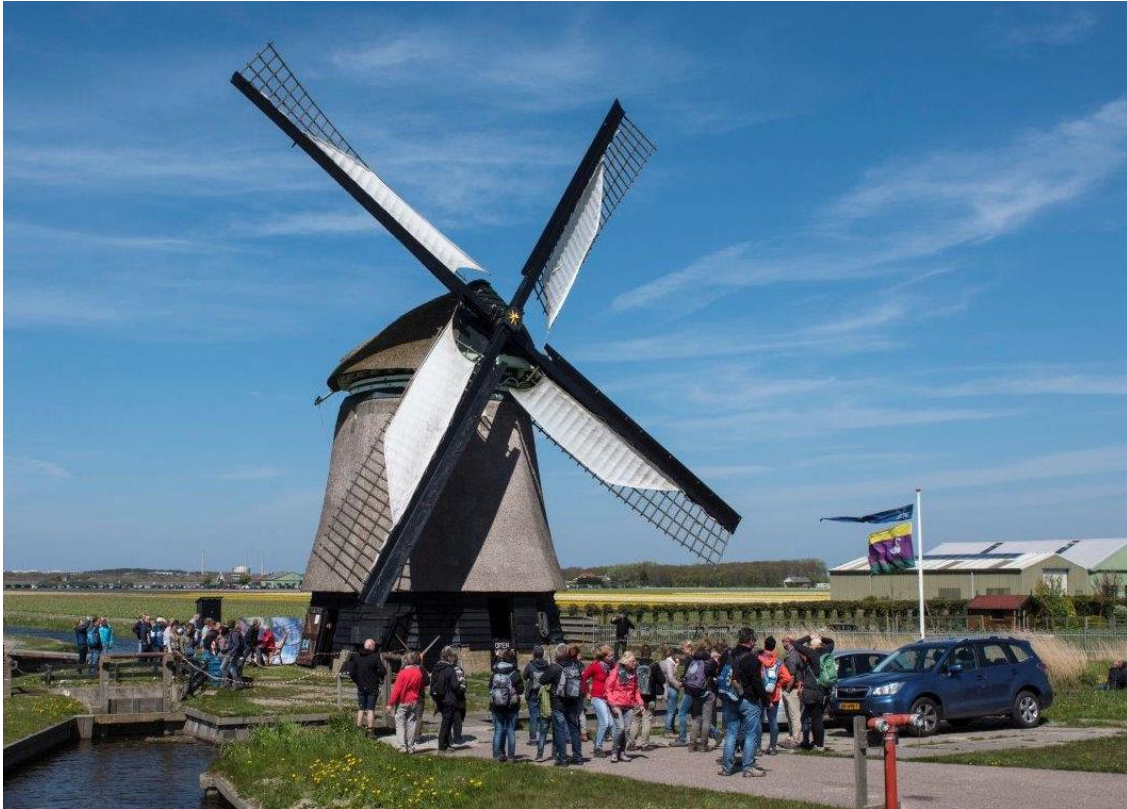
Zijper Molen Noorder M, 30 april 2017, wandeltocht bloeiend Zijpe