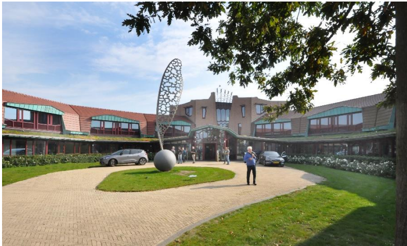
Het gemeentehuis van Texel, in een prachtig najaarszonnetje