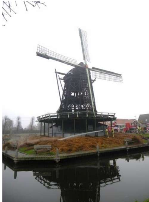
Wat resteert na het sein brand meester