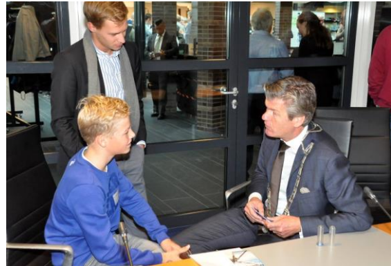
In gesprek met enkele deelnemers