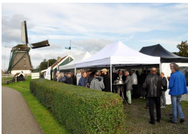
Afsluiting bij De Oude Knegt

Na de lunch, aangeboden door de gemeente Castricum werden de aanwezigen verdeeld over twee bussen en werd een bezoek gebracht aan de molens De Kat, De Dorregeester en De Oude Knegt. Bij deze laatste molen werd de dag met een borrel en een hapje in een heerlijk zonnetje werd afgesloten.