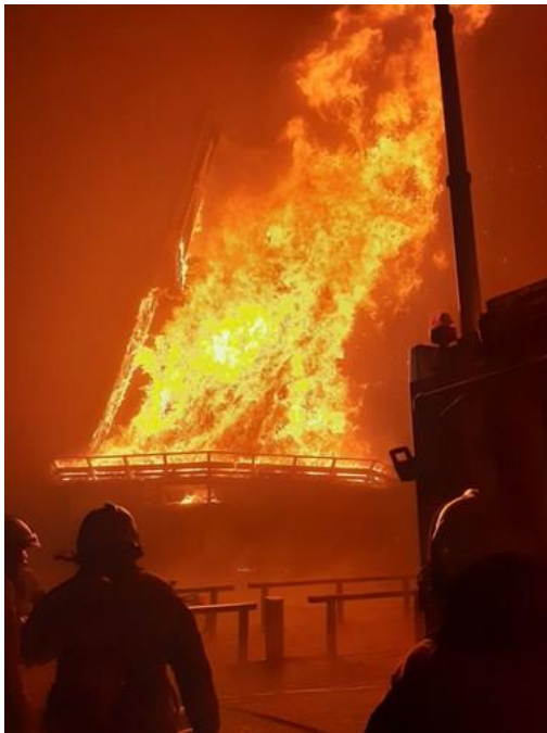
De Ceres dreigt volledig in vlammen op te gaan

Vuurwerk heeft tijdens de laatste jaarwisseling rampzalige gevolgen gehad voor korenmolen Ceres in Bovenkarspel. De schade aan de molen is groot, het enige positieve is dat het skelet nog redelijk intact is. Dat is zeker ook te danken aan het adequate optreden van de brandweer, die wist waar ze zich bij het bestrijden van de vuurzee op moest richten. Een domper wel voor de vele vrijwilligers die bij deze molen, die in eigendom en beheer is bij Stichting De Westfriese Molens, betrokken zijn. En een schok voor de medewerkers van zorgbakkerij De Molenwiek, die zijn meel betreft van molen Ceres. Het probleem met een dergelijke brandschade is dat vrijwel niet te achterhalen wie de veroorzaker is, reden waarom het verhalen van deze schade niet mogelijk is. En dat betekent dat de premies voor het verzekeren van, in dit geval, molens daardoor sterk omhoog gestuwd worden. Het is eigenlijk onbegrijpelijk dat overheden niet massaal voorzien in een verbod op het gebruik van vuurwerk in de nabijheid van molens. In het ontwerp van de provinciale Omgevingsverordening is bijvoorbeeld wel een verbod opgenomen op het gebruik van vuurwerk in stiltegebieden, dan zou een verbod op vuurwerk bij molens toch ook moeten kunnen. De Noord-Hollandse Molenfederatie zal zich de komende tijd inzetten om een dergelijk verbod, linksom of rechtsom, tot stand te brengen.