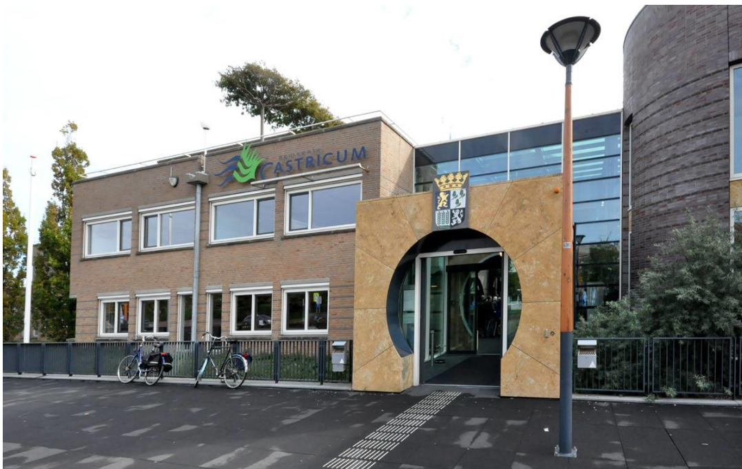
Het gemeentehuis van Castricum, waar het ochtenddeel van de molencontactdag plaatsvond

En natuurlijk was er ook weer de Noord-Hollandse Molencontactdag. Dit jaar waren op 5 oktober we te gast bij burgemeester Mans in de gemeente Castricum en bij de Stichting Uitgeester en Akersloter Molens.