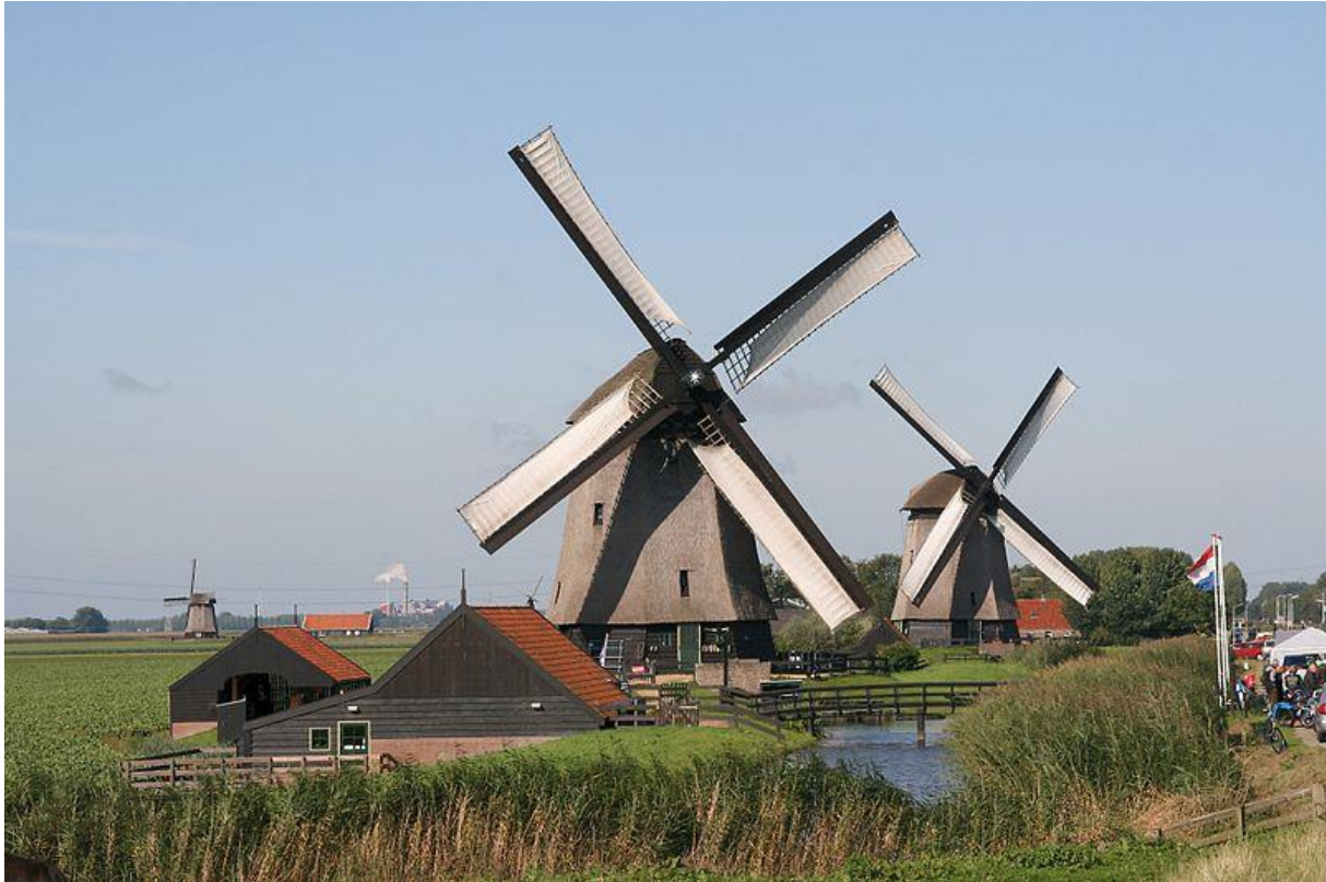
Ondermolen D (museummolen Schermer Molens), met daarachter ondermolen C en links in de verte poldermolen O

In ons jaarverslag van 2017 meldden wij dat in de subsidieregeling, na een pleidooi van de NH Molenfederatie, speciaal voor molens, weer een minimumsubsidiebedrag van € 5000,-- was opgenomen, waardoor molens eerder in aanmerking kwamen voor een tegemoetkoming. Vanwege kritische opmerkingen in een rapport van de Randstedelijke Rekenkamer over dubbelfinanciering van dezelfde activiteiten (vanuit een rijksregeling voor monumenten en deze provinciale regeling) is met ingang van 2019 het minimumsubsidiebedrag voor restauraties gebracht op € 35.000,-- . Het is niet duidelijk of het aantal aanvragen voor deze subsidieregeling in 2019 daarom beperkt bleef tot maar één, maar de Noord-Hollandse Molenfederatie blijft de effecten van deze bijstelling van de regeling volgen.