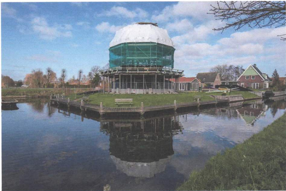
Afbeelding 1 De, in het kader van de herstelwerkzaamheden, ingepakte Ceres

De vuurwerkdiscussie in Nederland is volop gaande. En op dit punt heeft corona tijdens de laatste jaarwisseling in ieder geval wel geholpen: om de druk op de ziekenhuizen, huisartsposten en handhavers op straat te verminderen gold er een verbod op de verkoop en op het afsteken van vuurwerk. Maar een totaal verbod op vuurwerk is nog niet echt in zicht, dus ook dit jaar zal de Molenfederatie zich blijven inzetten voor een plaatselijk te regelen verbod in de omgeving van molens.