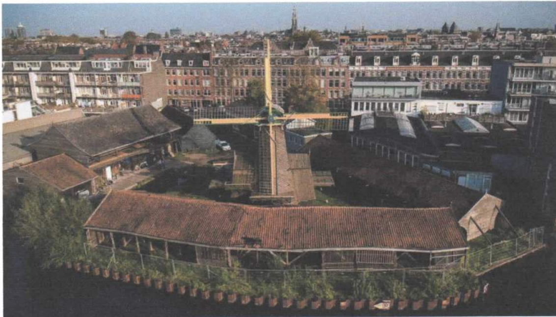
Afbeelding 2 Molen De Otter Amsterdam, met houtloodsen