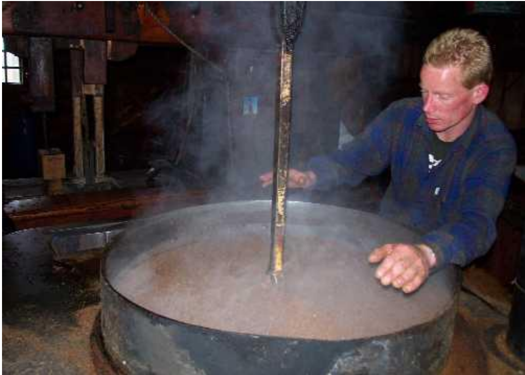
Oliemolen met het Vuister