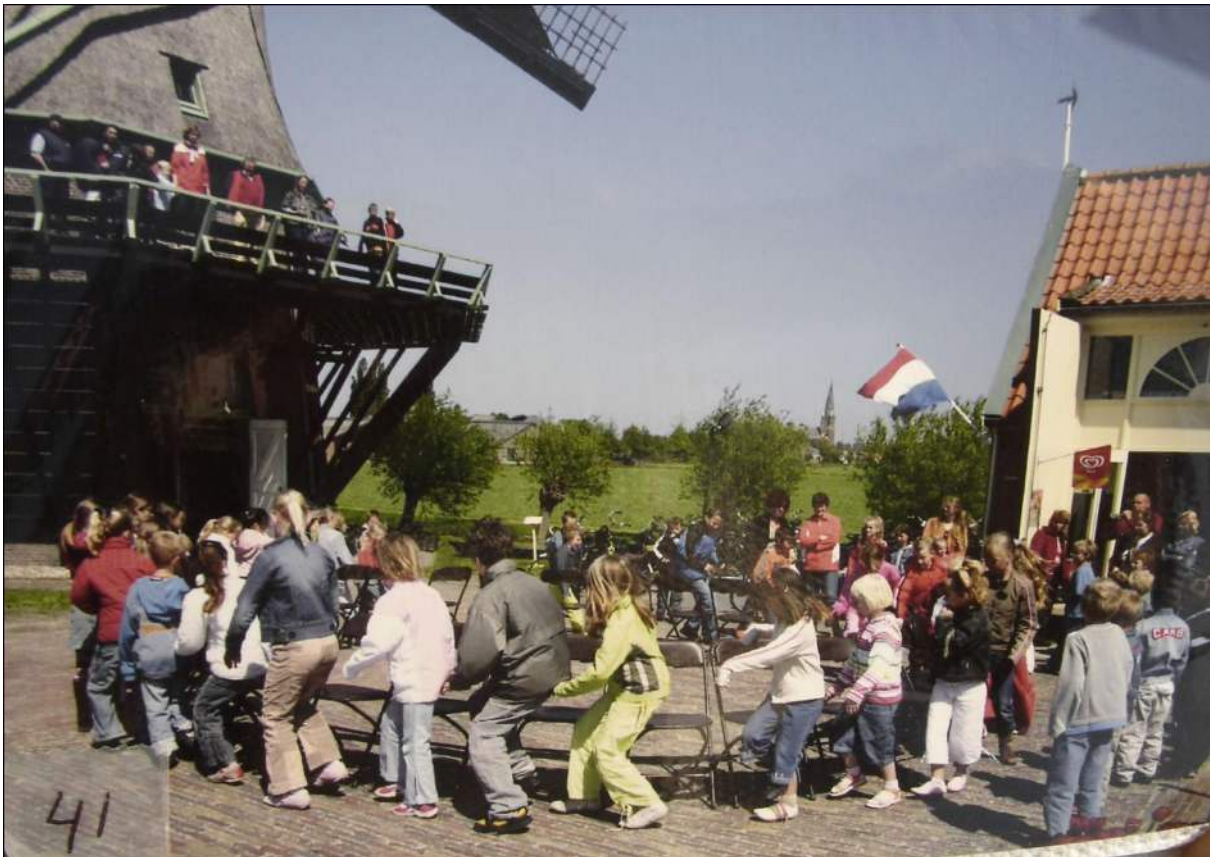
De Hoop te Wervershoof, activiteiten met kinderen