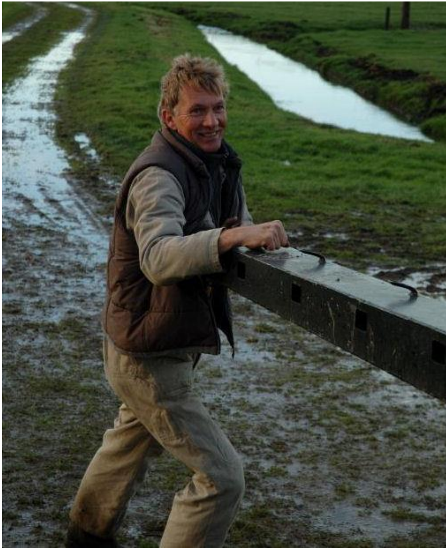
Roede steken, De Dorregeester, Uitgeest

Voor vragen over dit rapport en interviews kunt u terecht bij: