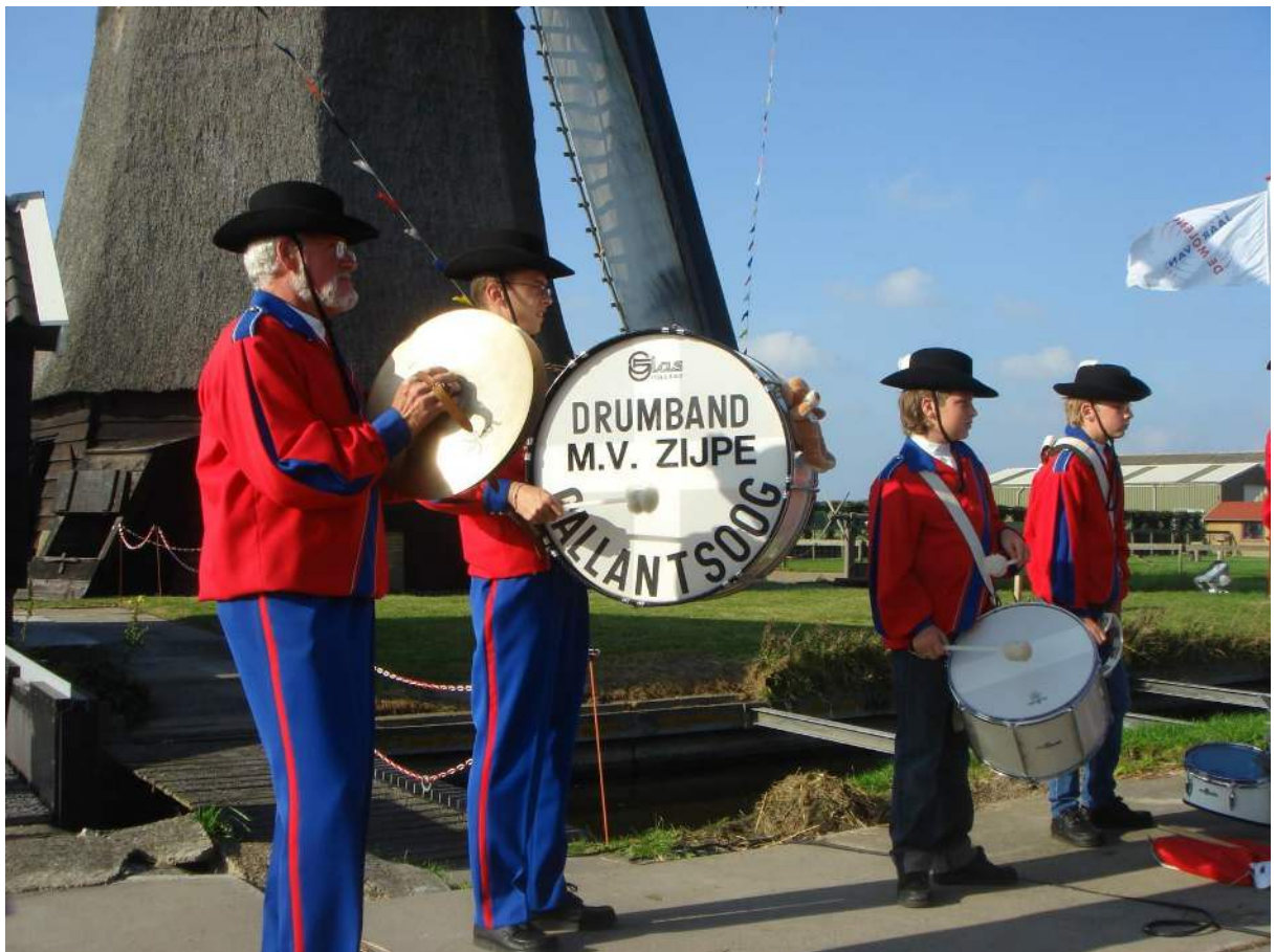
Molen Noorder-M te Zijpe tijdens de Molencontactdag 2007