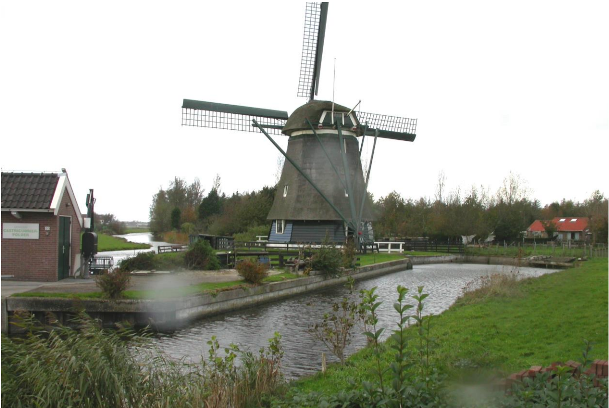
Molen De Dog, Akersloot