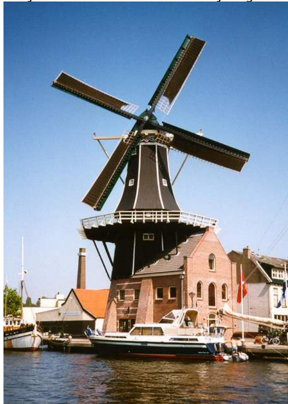
De Adriaan te Haarlem