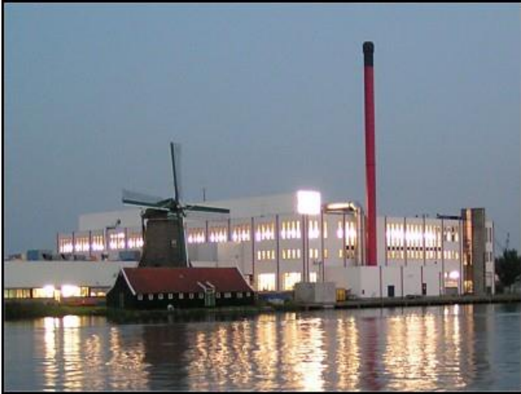
De Ooievaar te Zaandam, verpeste molenbiotoop

De Stichting Uitgeester en Akersloter molens, het HHNK, gemeente Uitgeest en de Molenfederatie organiseren samen informatieve avondbijeenkomsten met burgers en bedrijven om de mogelijkheden voor vrijwillig landschapsbeheer in molenbiotopen te bespreken. De eerste molenbiotopen zijn opgeknapt met hulp van vrijwilligers in samenwerking met Landschap Noord-Holland. De resultaten zijn veelbelovend: meer bloemen in de weide en zeldzame orchideeën. Ook worden molens en molenbiotopen beter aangesloten op wandel- en fietsroutes.