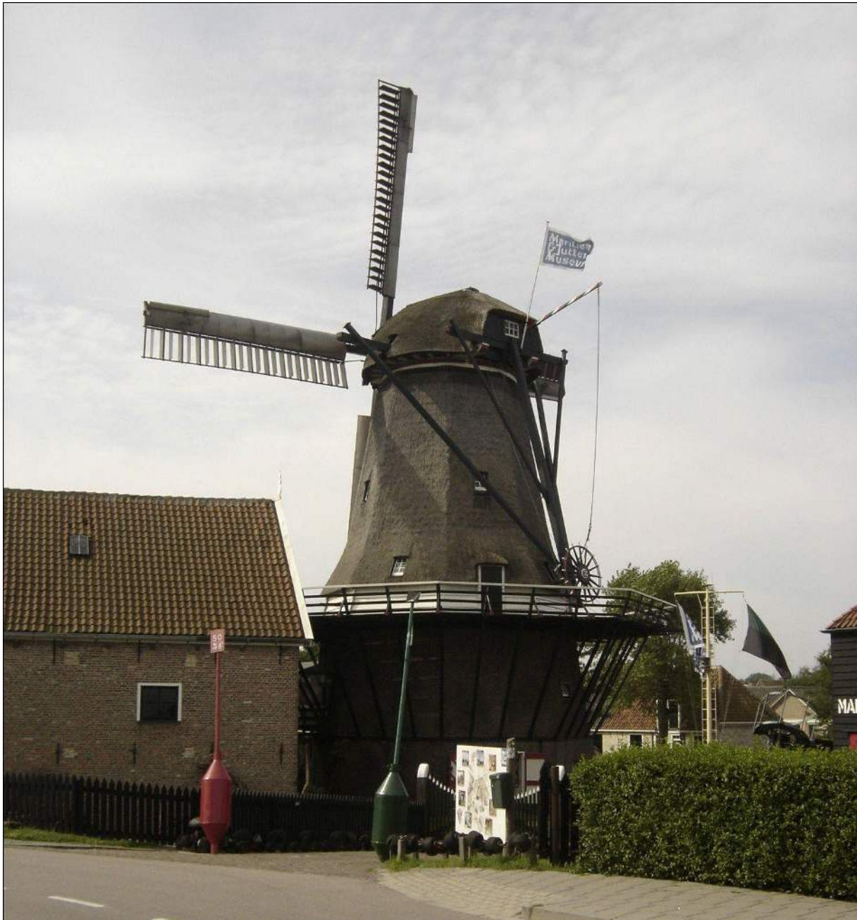
De Traanroeier te Oudeschild, Texel