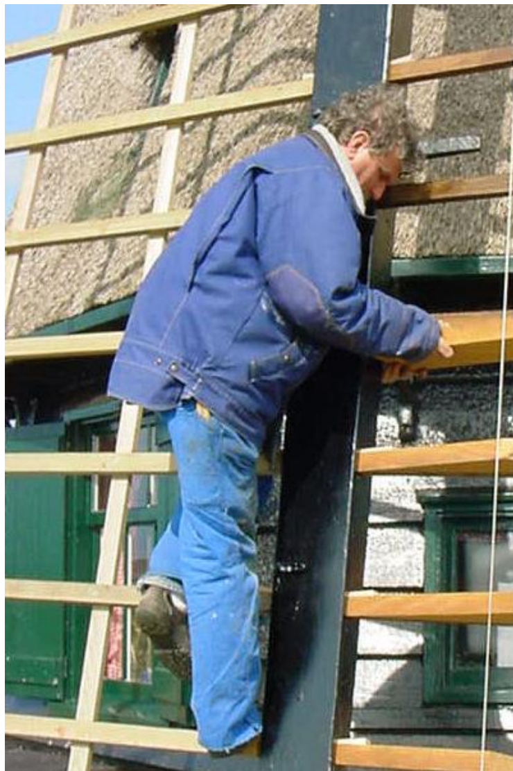
Molenmaker aan het werk bij de Wimmenumer Molen

Naast de provinciale subsidieregelingen voor molens hebben wij in dit onderzoek ook gekeken naar andere financiële aspecten, waaronder verzekeringen, het BRIM van het Rijk en een vergelijking tussen de provinciale subsidieregelingen voor molens in Zuid-Holland en Noord-Holland.