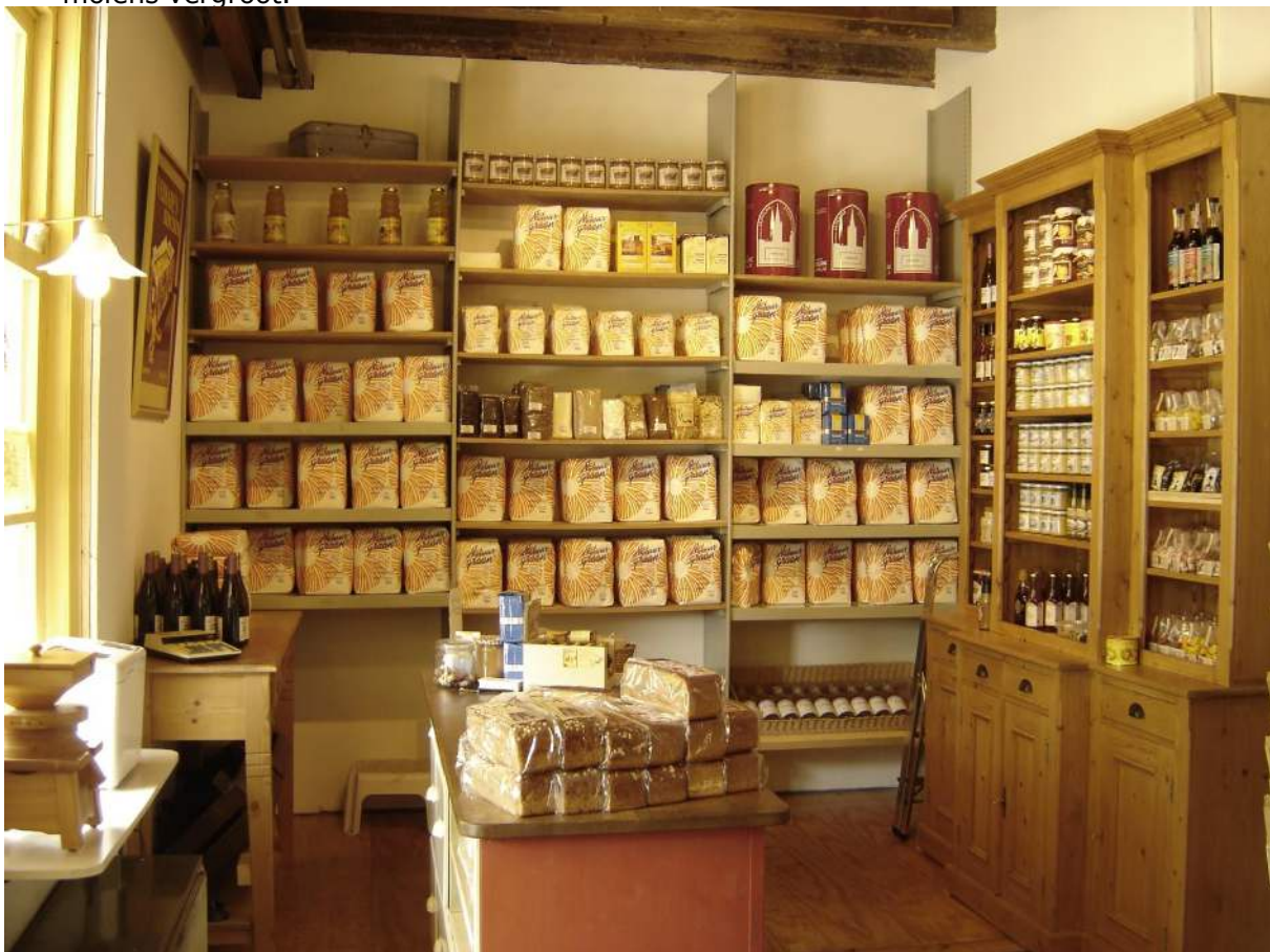
Winkel in molen De Krijgsman te Oosterblokker