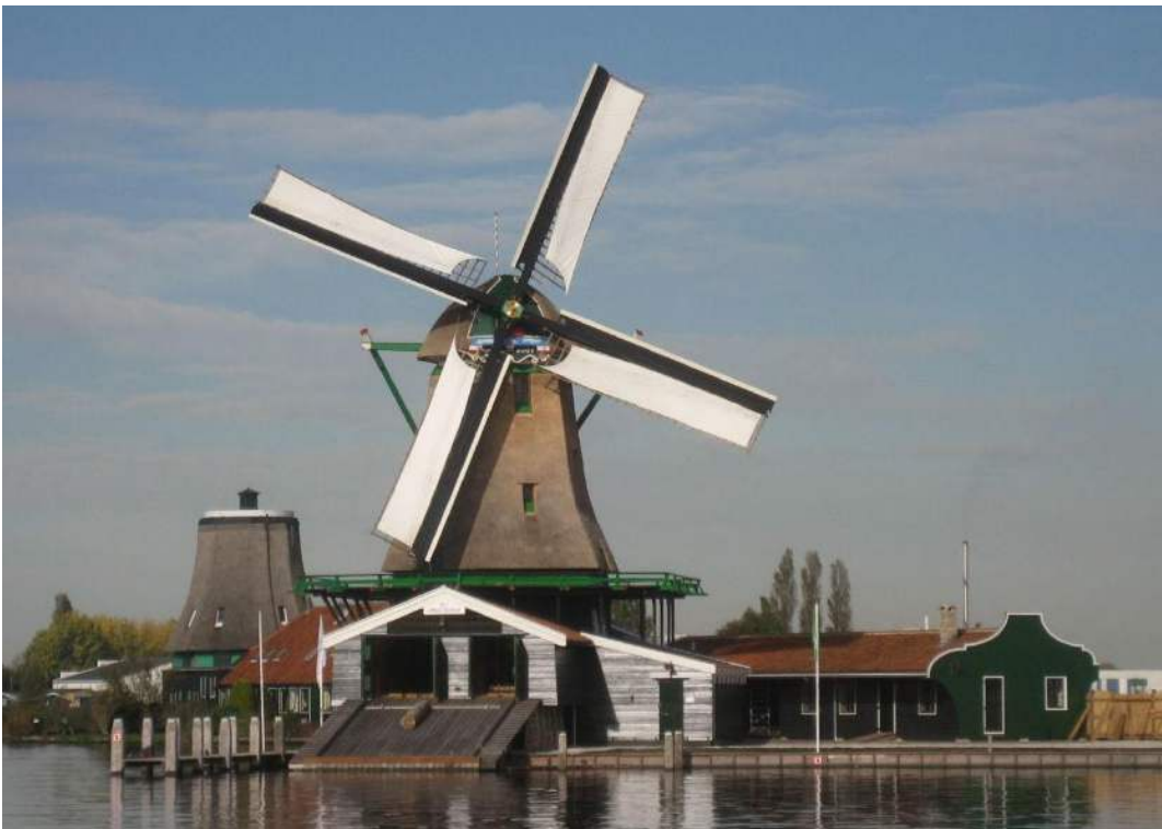
Het Jonge Schaap te Zaandam voltooid