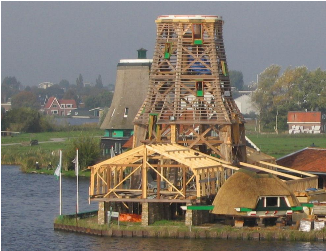
Het Jonge Schaap te Zaandam in aanbouw