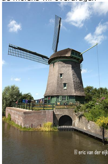
Molen Westtuit No 7