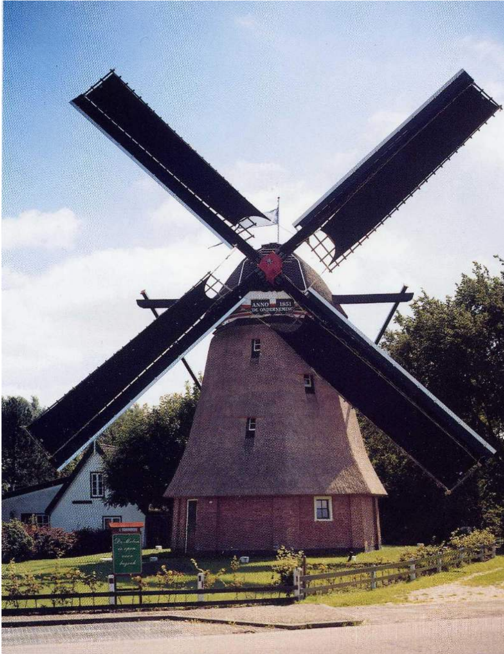
Molen De Onderneming, Hippolytushoef