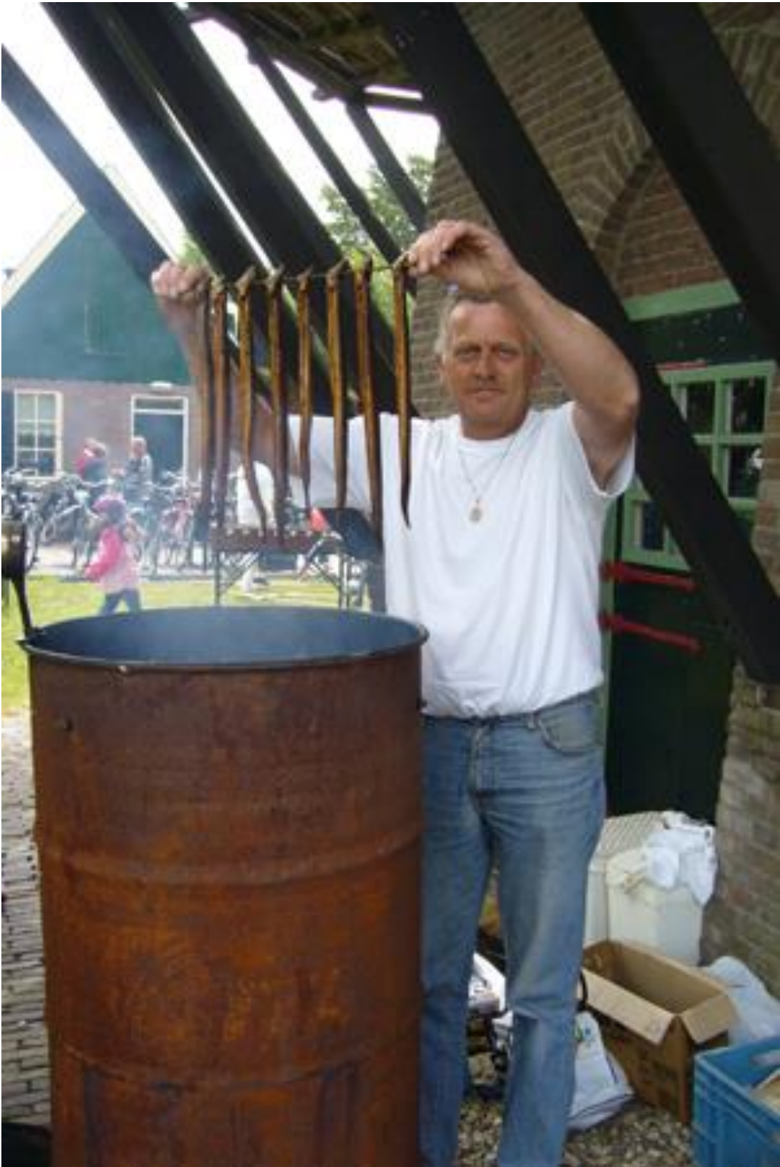
Vrijwilliger bij de Werverhoofse molen