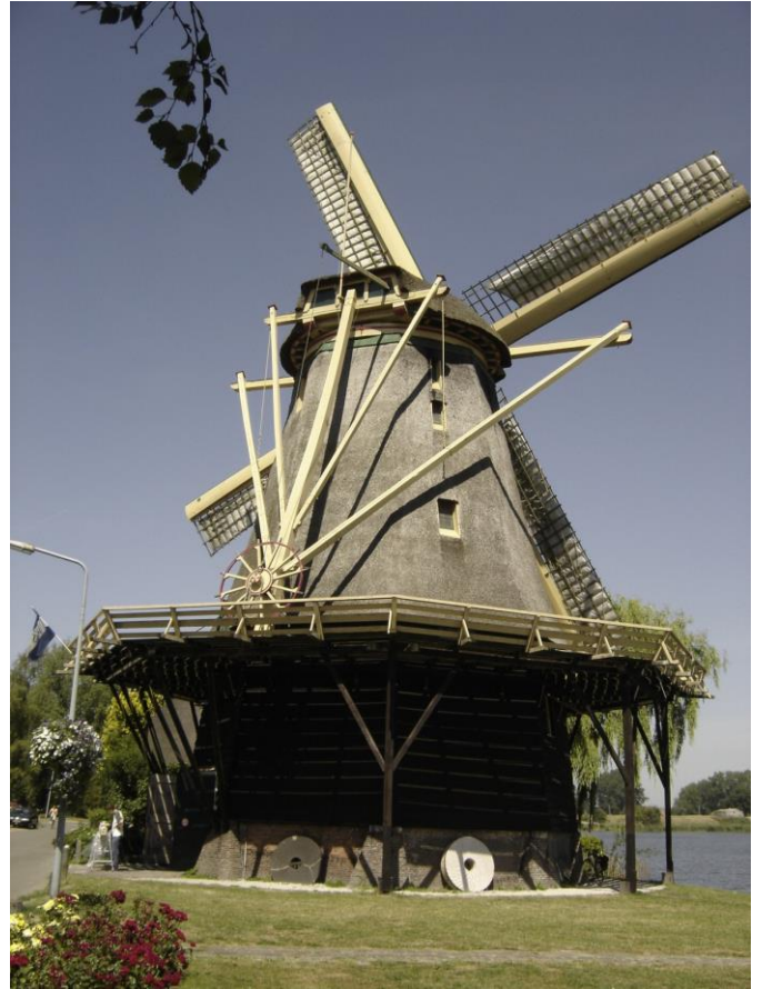
Molen de Vriendschap te Weesp