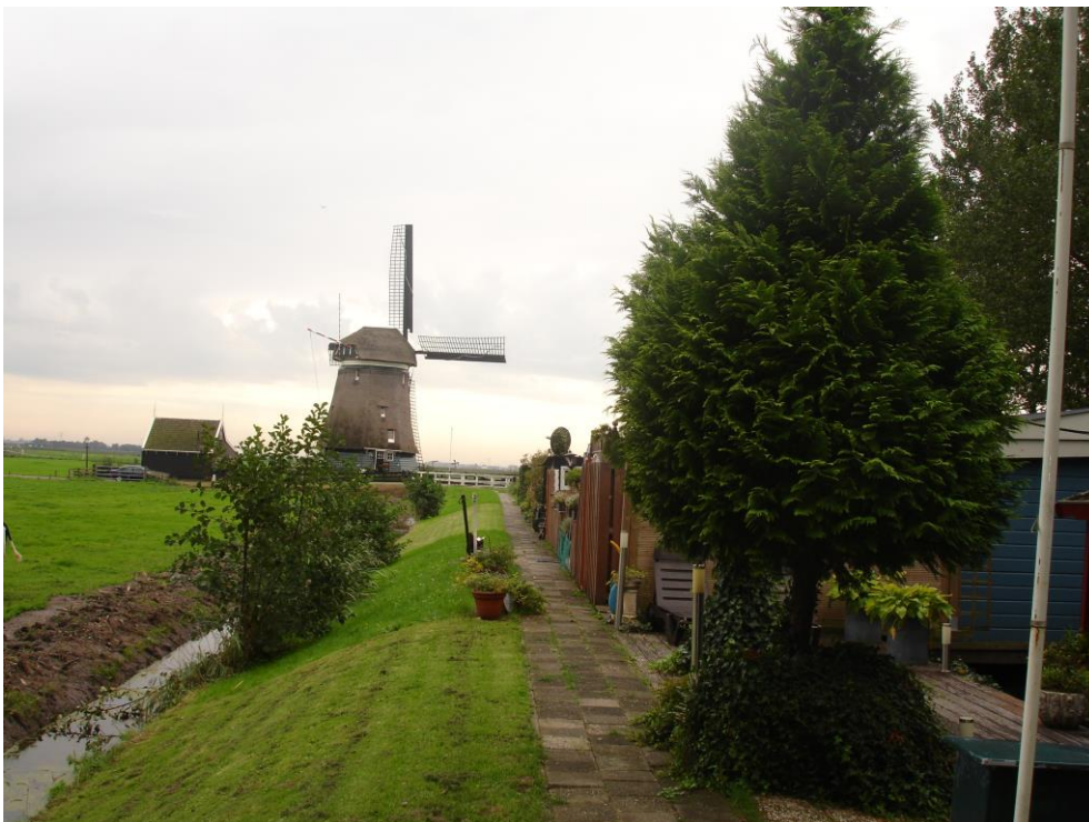
Tweede Broekermolen, tweede molenbiotoopproject van de SUAM