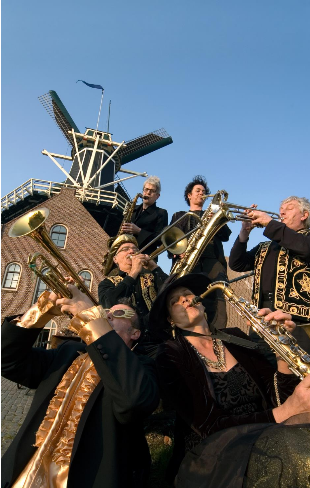
Molen De Adriaan, Haarlem, in het kader van het jaar van de molens 2007