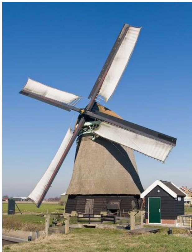
Molen Noorder-M van de Zijpe, Sint Maartensvlotbrug