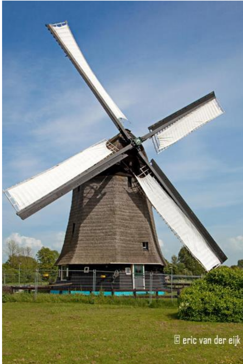
Strijkmolen E van De Zes Wielen te Oudorp, gerestaureerd