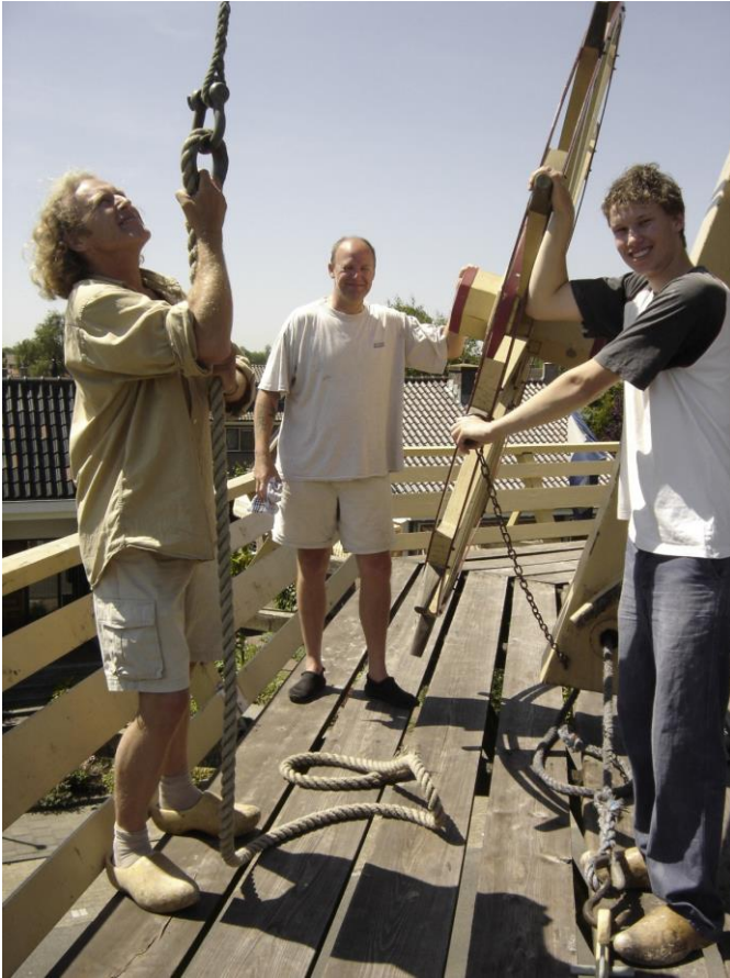
Vrijwilligers bij Molen de Vriendschap te Weesp