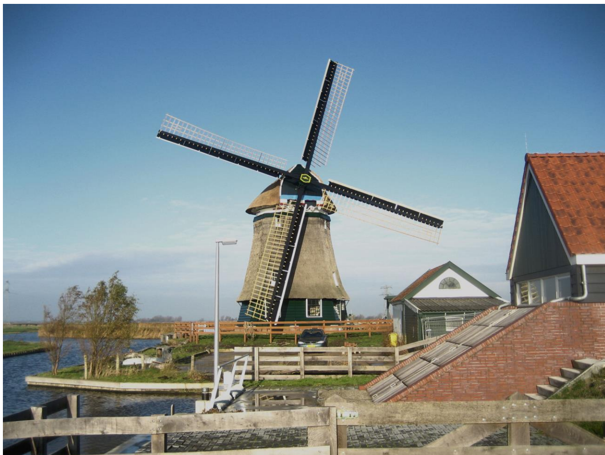
De Woudaap Krommeniedijk