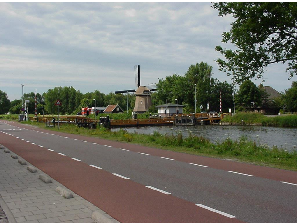
De Sluismolen Alkmaar, eerste molenbiotoopproject van PMC