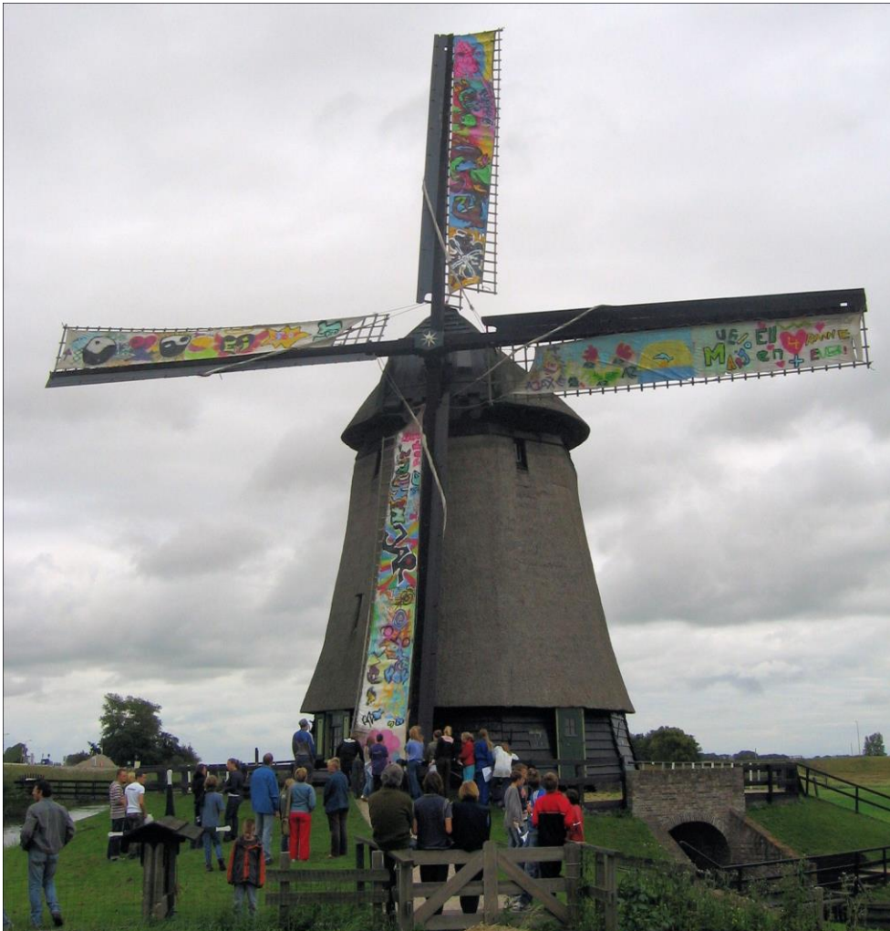
Middenmolen D, Schermer