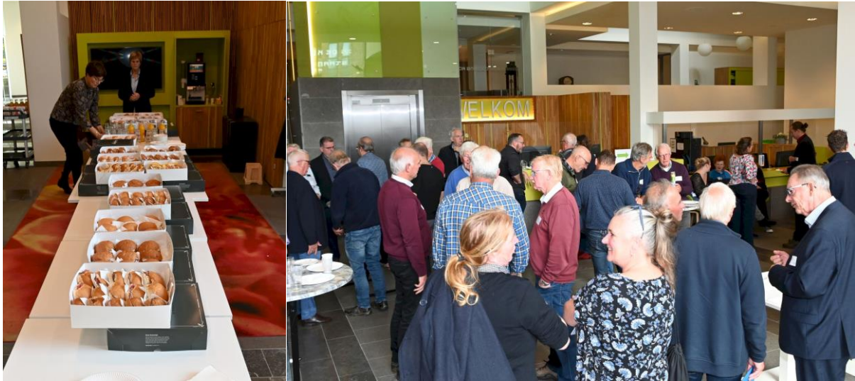
De lunch wordt klaargezet, waarna eenieder zich te goed doet