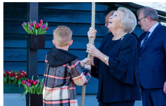
Prinses Beatrix licht de vang van molen Ceres en heropent daarmee de molen

In ons jaarverslag over 2021 berichtten wij over de heropbouw van korenmolen Ceres in Bovenkarspel, na de bijna fatale brand tijdens de jaarwisseling in 2019. Die heropbouw is inmiddels voltooid. Op 18 maart 2022 is de gerestaureerde molen officieel heropend door prinses Beatrix. Hiernaast een foto van het moment van de openingshandeling. Rond elke jaarwisseling houden molenaars in heel Nederland hun hart vast als het knallen weer begint, maar ook de jaarwisseling 2021/2022 verliep op dit punt zonder incidenten. Het wachten is op een totaal verbod op vuurwerk.