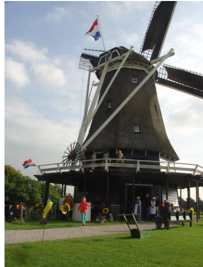
Meelmolen De Herder Medemblik

Met ingang van 2019 is het minimumsubsidiebedrag voor restauraties gebracht van € 5.000,-- naar € 35.000,--, na kritische opmerkingen in een rapport van de Randstedelijke Rekenkamer over het op dat moment geldende minimum bedrag. Overigens wordt ook met dit hogere minimum bedrag nog altijd rekening gehouden met het gegeven dat molens over het algemeen aanvragen indienen van een relatief geringere omvang.