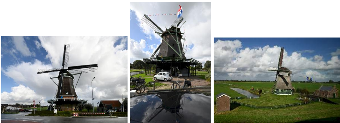
Achtereenvolgens molen De Hoop, molen Ceres en De Grote Molen werden met een bezoek vereerd.

De dag werd afgesloten met een hapje en een drankje in molen De Krijgsman in Oosterblokker, met uiteraard nog de mogelijkheid om ook deze molen van binnen te bekijken.